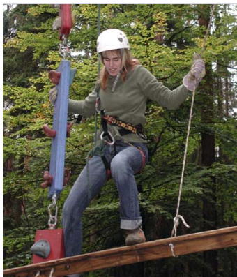
Fliegende Brücken Mut und Teamarbeit