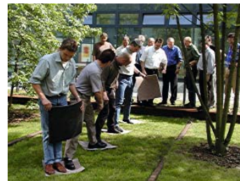
Feuerfluss Planvolles, abgestimmtes Vorgehen