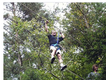
Seilsteg Ängste im Team überwinden