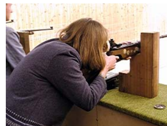
Schieß-Übung Ziele planen und realisieren