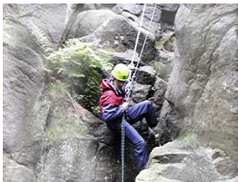
Seil-Übung Vom Team „abhängen“