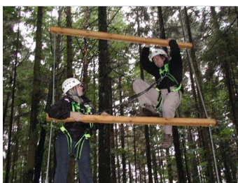
Gigantenleiter Teamwork in Stress- situationen