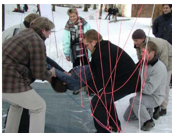
Spinnennetz Koordination aller Kräfte