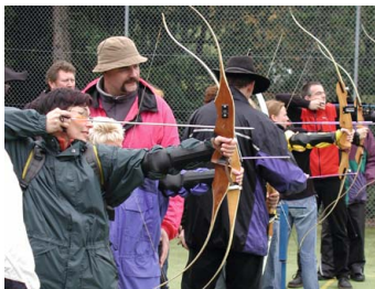
Bogen- schießen Wie qualifiziere ich mein Team?