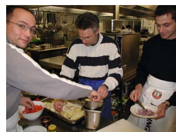
Koch-Übung Kreativität und Produktivität im Team