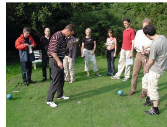
Golfübung Zielverein- barung als Erlebnis