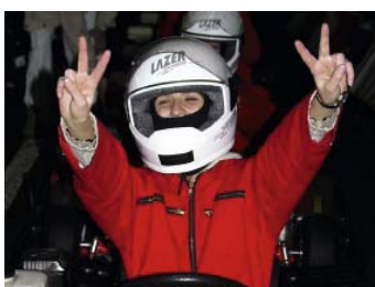
Kart-Übung Koordination der Teamkräfte