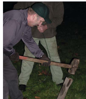
Freie Übung Teamleistung für soziale Themen