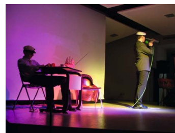
Theater- Übung Das Team lernt vom Schau- spielprofi