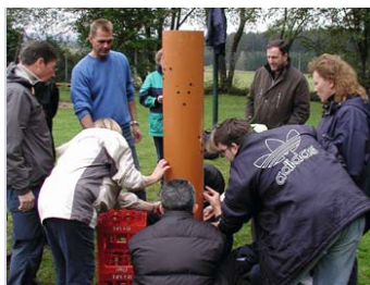
Wasserrohr Den Team- kollegen vertrauen