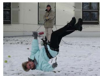
Feuersee Optimale Koordination des Teams