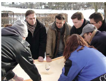
Wasserglas Koordination der Teamkräfte